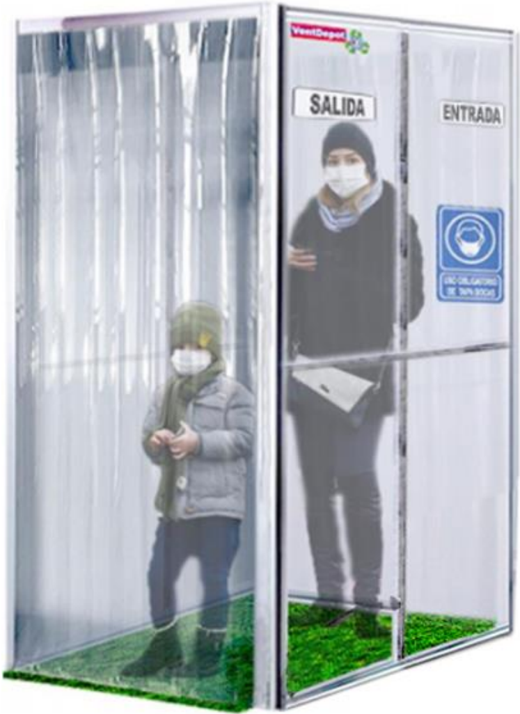
Galería del Túnel de Desinfectante Sonic Safe.