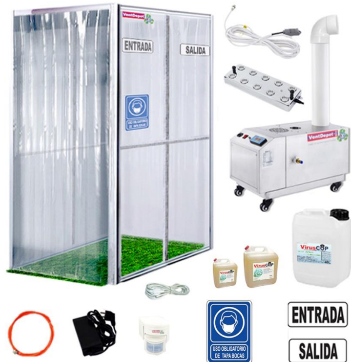
Características Técnicas Específicas del Túnel de Desinfección, Sonic Safe.

El Túnel de Desinfección SonicSafe, tiene una garantía de un año, sujeto a cláusulas VentDepot.