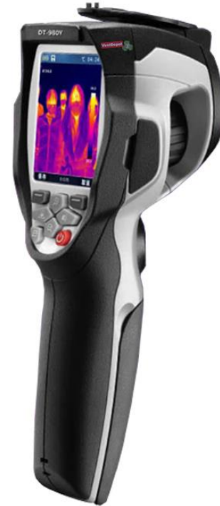
Características Técnicas Específicas de la Cámara Térmica Infrarroja, ThermalPack.

El ThermalPack, cuenta con 1 año de garantía sujeto a cláusulas de VentDepot.