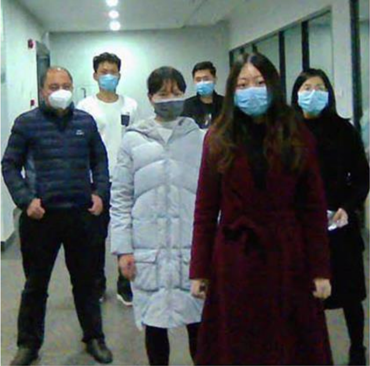
Galería de la Cámara Termográfica, ThermalPack.