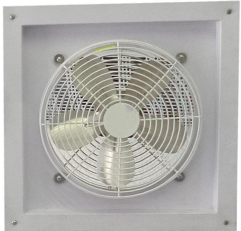
Características técnicas específicas del Extractor, AxiFan.

El AxiFan tiene una garantía de 1 año certificado por escrito, Sujeto a las Cláusulas de garantía de VentDepot.