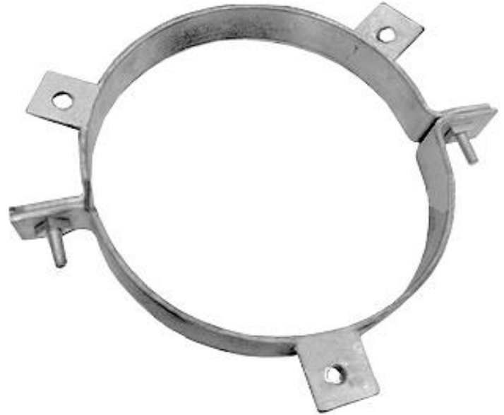
Características Técnicas Específicas de los Soportes para Ductos AroxApoyo

Los Soportes para Ductos AroxApoyo tienen una garantía de 1 año certificado por escrito, Sujeto a las Cláusulas de garantía de VentDepot.