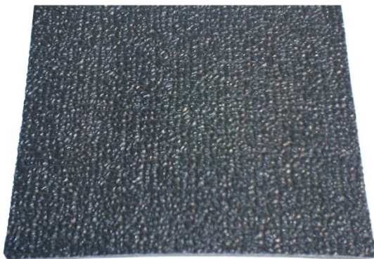
Película de vinil en color negro