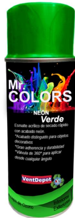
Características Técnicas Específicas de latas de pintura en aerosol, AeroNeon.

El AeroNeon, cuenta con 1 año de garantía sujeto a cláusulas de VentDepot.