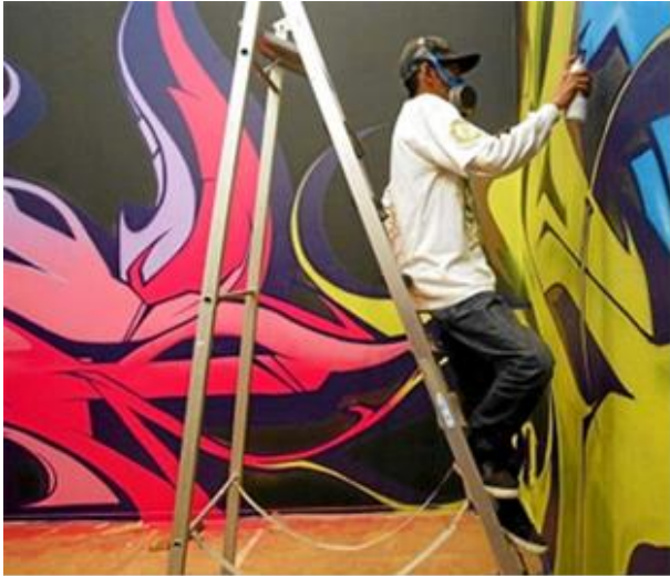
Galería de las pinturas en aerosol, AeroNeon.